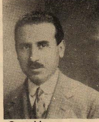
Mustafa Suphi ve Şefik Hüsnü